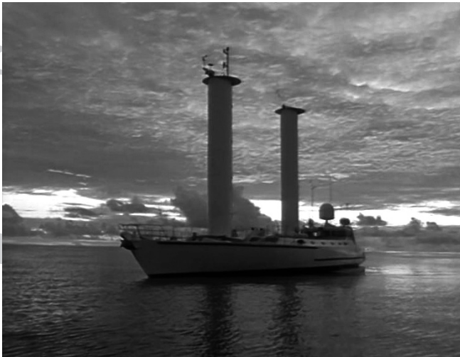
Кадр из фильма «Науру: остров или планета?»

В начале 70-х Кусто и его сын Филипп начинают съемки фильмов, посвященных глобальным экологическим проблемам. Увлеченный подвижнической деятельностью отца, Филипп с малых лет жил, а потом и работал на «Калипсо», ставшем для семьи Кусто настоящим домом. «В наш век рациональности, научности и окупаемости мы отплывали без какой-либо конкретной цели, без драконовских ограничений во времени, не обязанные