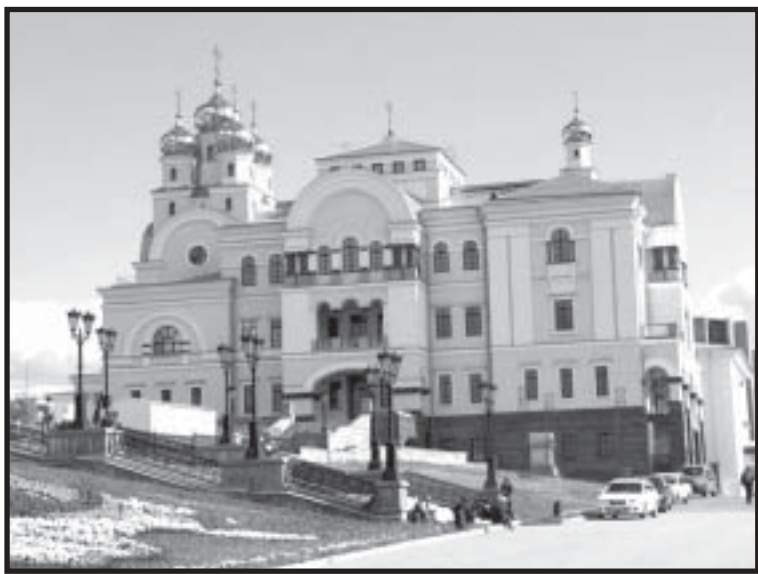
Здание, которое экологи считают черноморской резиденцией Патриарха.

рию под Дивноморском рядом с Геленджиком.